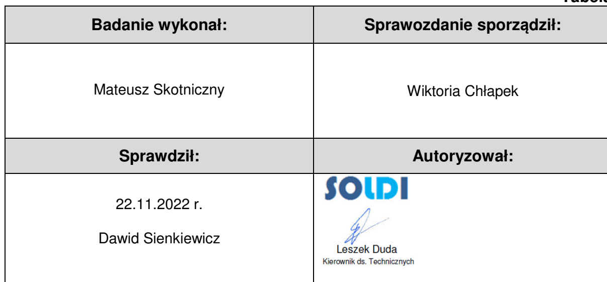
Tabela nr 6

Stwierdzenia zgodności dokonano na podstawie zasady podejmowania decyzji i wymagań zawartych w załączniku do Rozporządzenia Ministra Klimatu z dnia 17 lutego 2020 r. w sprawie sposobów sprawdzania dotrzymania dopuszczalnych poziomów pól elektromagnetycznych w środowisku [Dz. U. 2020, poz. 258, Dz. U. 2022, poz. 1121].