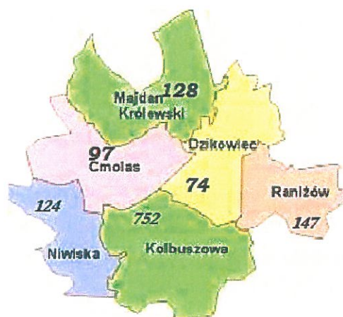
Rysunek 1 Liczba osób korzystających usług PPP w Kolbuszowej wg miejsca zamieszkania